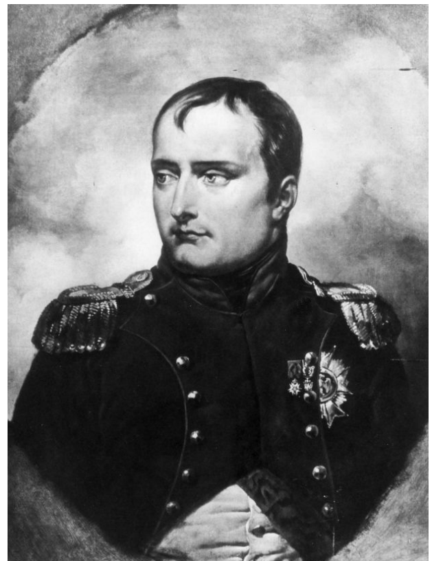
Napoleon I Bonaparte

Dazu kamen noch weitere Kontingente aus den Staaten des Rheinbundes dem Königreich Westphalen und Sachsen. Selbst Österreich und Preußen hatten Hilfskorps für Napoleon aufzustellen, Österreich 30 000 Mann, Preußen 20 000. Im Internet bei Wikipedia heißt es dazu: „Der Kampfwert dieser beiden Korps, die einige Jahre zuvor noch gegen Frankreich gekämpft hatten, war nicht sehr groß. Es fehlte an Motivation, um für Napoleon gegen ehemalige Verbündete kämpfen zu müssen.“