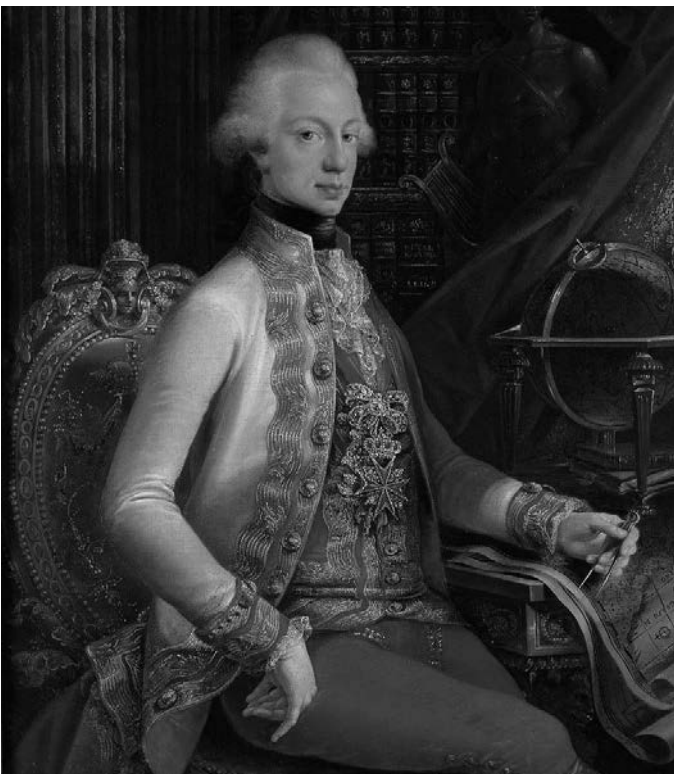
Großherzog Ferdinand III von Toskana

Zu den Standardwerken zählt Karl Bosl, Bayerische Geschichte, 2. Auflage, München 1980